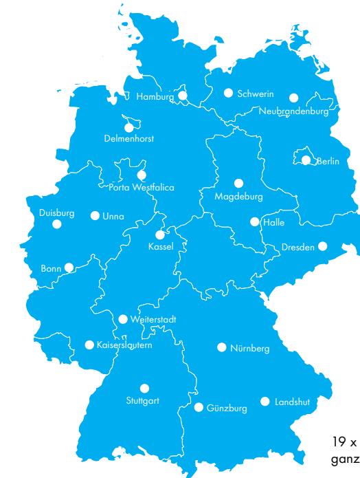
19 x in Deutschland: Seminare ganz in Ihrer Nähe.